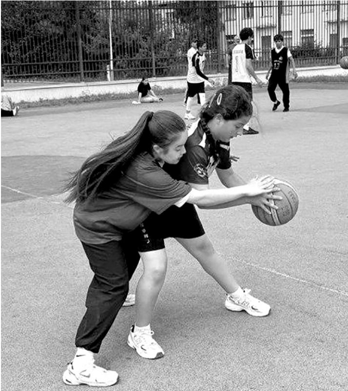
На республиканском этапе Президентских спортивных игр

Подготовили ТАТЬЯНА ИВАНОВА, ПОЛИНА СЕМЕНЧЕНКО