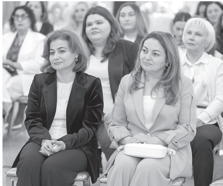
На одной из встреч Клуба деловых женщин

«Стоит отметить, такой подход расширяет границы предпринимательства, понимая его не только как бизнес в классическом смысле, но и как активную жиз-