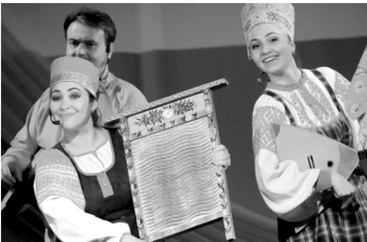
Выступает ансамбль «Вереск» из Выборга

в 2025 году конкурс посвящен Году защитника Отечества и 80-летию Победы в Великой Отечественной войне 1941–1945 годов и приурочен к 200-летию города Черкесска.