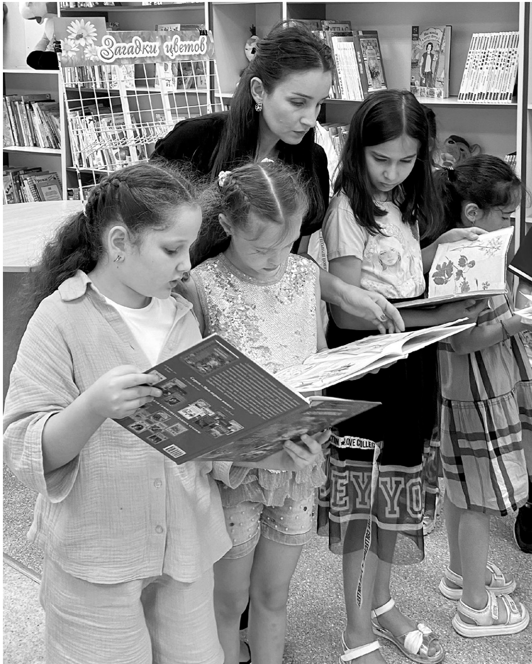
В июне библиотекари проводят мероприятия с детьми из пришкольных лагерей